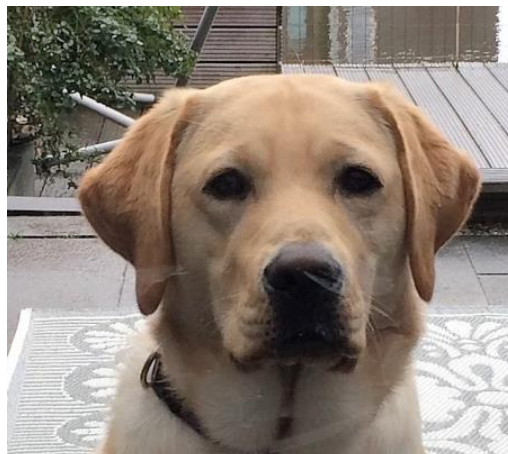
Spike 13 maanden oud